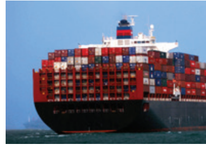
I compressori Gardner Denver sono a bordo delle navi da trasporto o da crociera che navigano attorno al mondo.

Le leggi sulla concorrenza sono complesse e possono comportare sanzioni molto severe. Per qualsiasi domanda contattare l'Ufficio Legale o l'Ufficio Compliance.