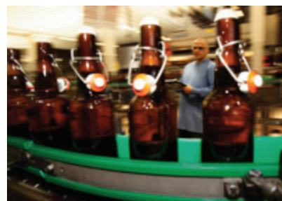
I compressori Gardner Denver sono utilizzati nella produzione e imbottigliamento della birra in tutto il mondo.

I documenti e i resoconti aziendali contengono le informazioni necessarie per gestire in maniera efficace le nostre attività e per permettere alla direzione di prendere decisioni corrette e informate. Tutti i resoconti aziendali, i consuntivi finanziari, le note spese, le registrazioni delle ore di lavoro, i bilanci e le scritture contabili devono essere oneste e accurate.