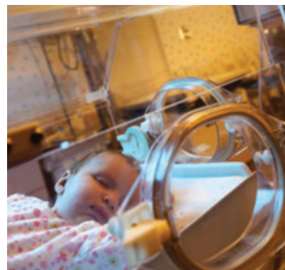
Gardner Denver produce componenti fondamentali per le apparecchiature utilizzate in ospedali, laboratori di ricerca e aziende farmaceutiche.

Tutti i dati conservati in formato elettronico nei computer dell'azienda sono di proprietà dell'azienda. I dipendenti devono essere consapevoli che non esiste alcuna garanzia di privacy quando utilizzano i computer o altre risorse dell'azienda.